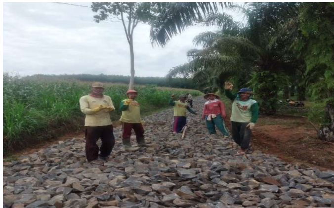
Gambar 4. Gotong Royong Pengerjaan Bantuan Pembuatan Jalan Usaha Tani

Berikut adalah badan jalan di ladang yang merupakan salah satu bantuan pemerintah kepada kelompok tani di Desa Tri Sinar.