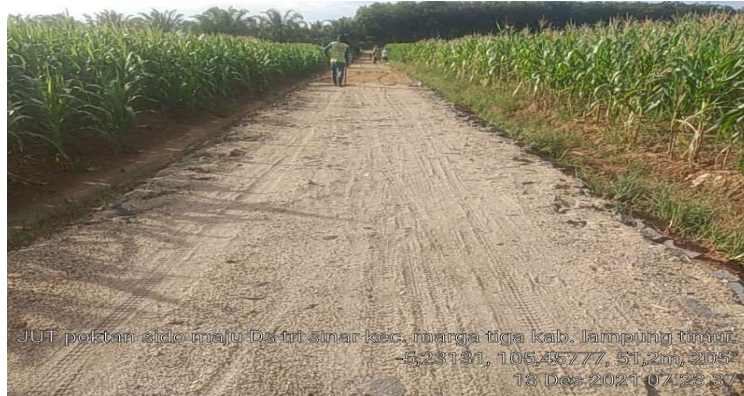
Gambar 5. Jalan Usaha Tani Desa Tri Sinar

membantu para petani dalam mengeluarkan hasil pertanian dan perkebunan (Wawancara pada Selasa, 14 Juni 2022 pukul 10.00 – 12.00 WIB).