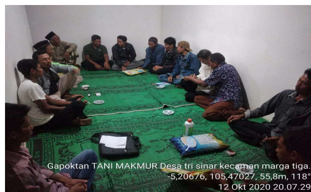
Gambar 3. Rapat Pemerintah dengan Gabungan Kelompok Tani Desa Tri Sinar

Bantuan dari Pemerintah kepada kelompok tani di Desa Tri Sinar disampaikan melalui rapat yang dihadiri oleh pengurus dan seluruh anggota kelompok tani. Dalam rapat tersebut dijelaskan mengenai tujuan pemberian bantuan berikut bentuk bantuan dan rencana tindak lanjut. Berikut adalah dokumentasi saat rapat pemberian bantuan tersebut.